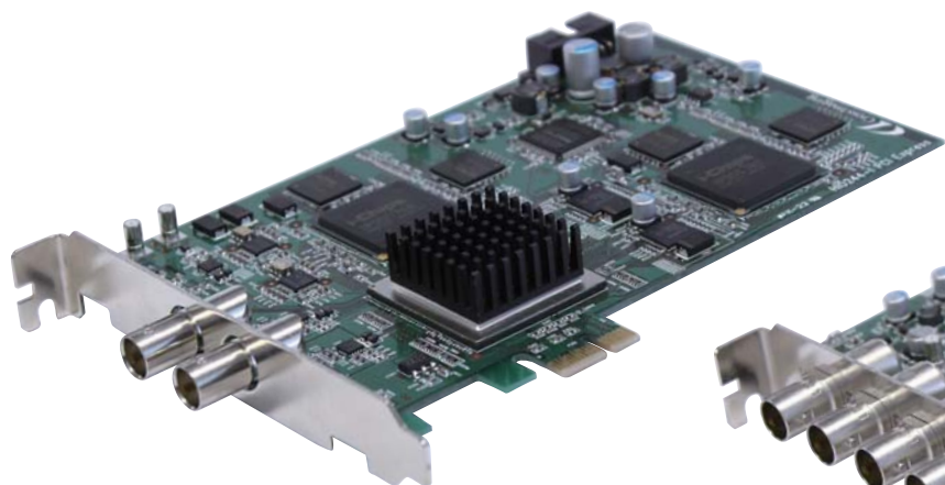
入力ボード(2系統入力)